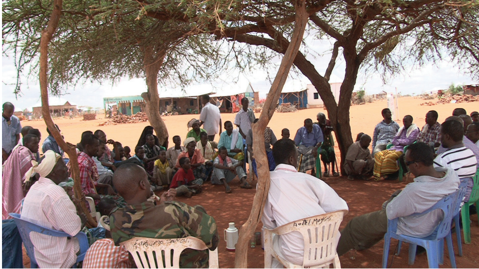
Sawirka X – Madal-dhaqaaheed lagaga wada-hadlayo xoojinta nabadda - Tuulo Jaalle, Gobolka Mudug