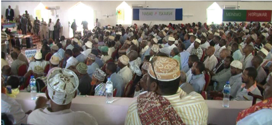
Shirweynaha Dastuurka Puntland. 480 ergey oo ka kala socda gobollada iyo degmooyinka Puntland ayaa shirweyne u fadhiya magaalada Garoowe 15-18 April 2012, halkaas oo looga doodadayo (loogu cod-qaadayo) dhaqan-gelinta Dastuurka Dawladda Puntland.