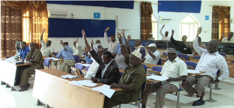
Baarlamaanka Puntland. Xubnaha Baarlamaanka Puntland waxa ay November 13, 2012, u codeynayaan shuruucda saldhigga u ah xabisidda burcad badeedda lagu qabtay Puntland, balse ay xukumeen maxkamado dalal shisheeye.