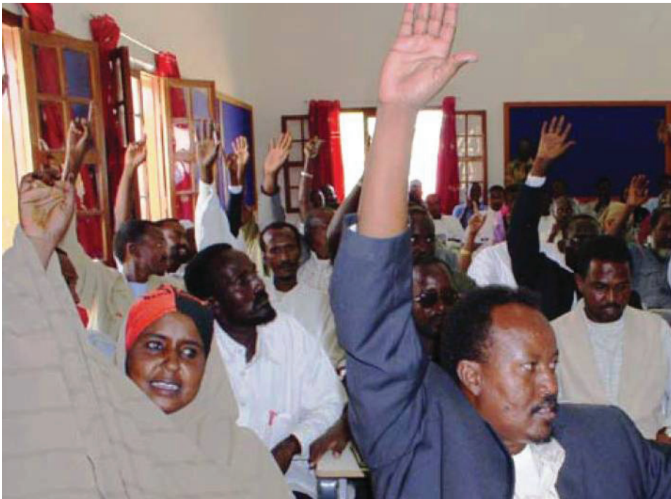
Doorashada Golaha Degaanka Degmada Garoowe 2005 (Wakhtiga hadda ah, xubnaha golaha degaanka waxa lagu doortaa hab qabiil. Hase yeeshee, sida ku xusan dastuurka cusub ee 2013, goleyaasha degaanka waxa lagu soo dooranayaa hab dimuqraaddi ah).