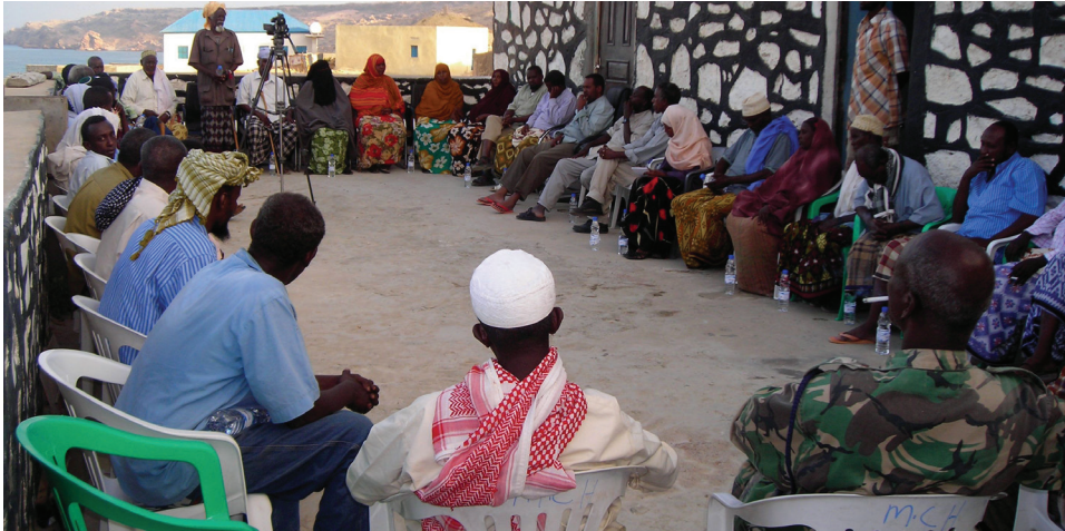
Wadahadal kooxeed degmada - Bander Bayla 2010 (goobtu waa xafiiska dawladda hoose ee degmada). Sawirka waxa ka muuqda wakiillo ka kala tirsan dhammaan qaybaha kala duwan ee bulshada oo ka wada qayb-qaadanaya hawlaha maamulka dawladda hoose (qorsheyn iyo go'aan gaaris).